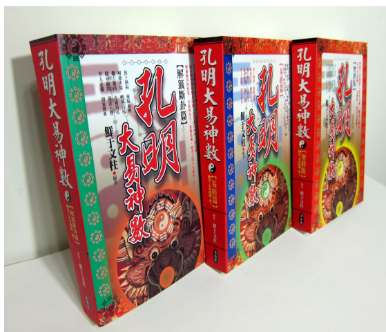
孔明大易神數 〈解籤斷卦篇、易經篇、基礎篇〉