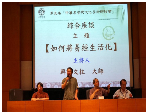
2016中華易學現代化學術研討會 論文發表及會場主持。