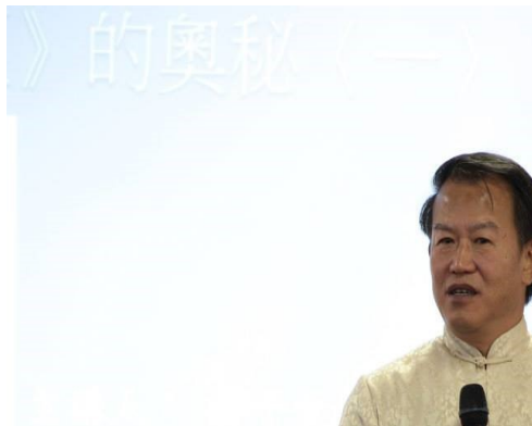
2013年受邀雪梨專題演講

之後，有關其中細節部分再閱讀《量子世界的奧秘》此書，就能夠輕車熟路、得心應手的進入此一領域！ 2020年第九屆中華易學現代化論壇發表論文：從易經占卜探討新冠疫情對中國大陸的影響。 在報章雜誌發表《易經》相關文章數十篇文章。