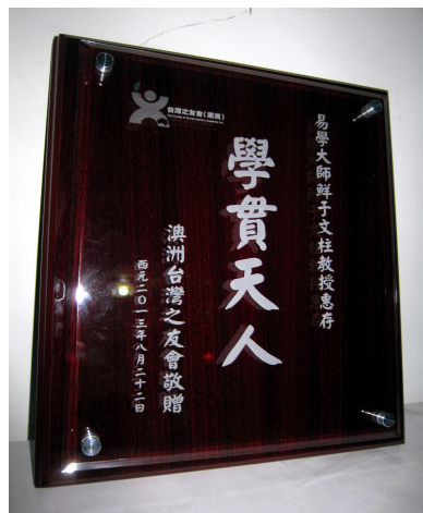
2013 年澳洲巡迴演講宣揚易學