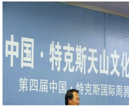
2015 年接受北京大學邀請，新疆特克斯八卦城國際周易論壇論文發表。