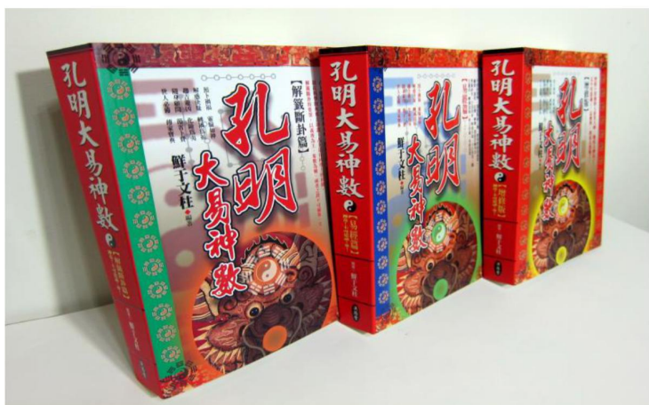
孔明大易神數 〈解籤斷卦篇、易經篇、基礎篇〉

2020.0115 以更淺顯易懂的方式，完成“揭開量子世界的秘密”論文一篇，分享對量子有興趣的讀者，讓讀者建立起一些初步概念之後，有關其中細節部分再閱讀《量子世界的奧秘》此書，就能夠輕車熟路、得心應手的進入此一領域！